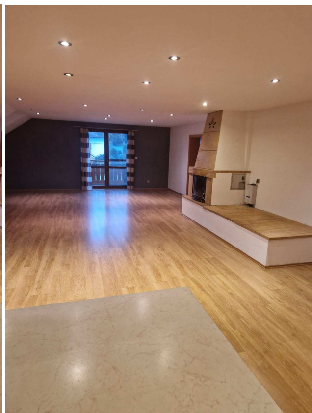
obývací místnost s kuchyní a dveřmi na balkon