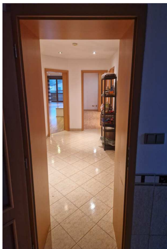
chodba v bytě