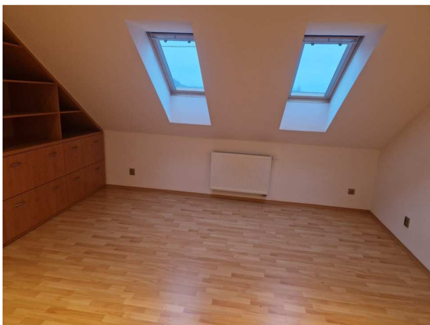
3 další obytné místnosti, jedna s přístupem na balkon